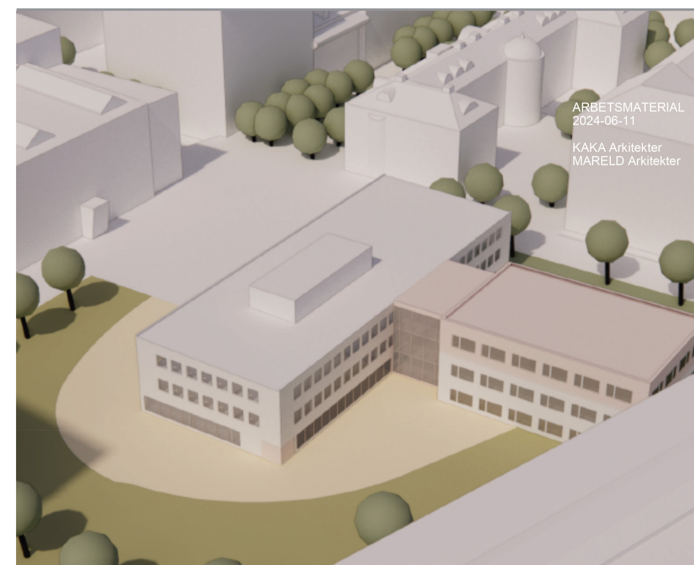
Skissförslag för en ny skola, alternativ 1 av 4. Återbruk av befintliga byggnader. Fågelperspektiv från sydväst.