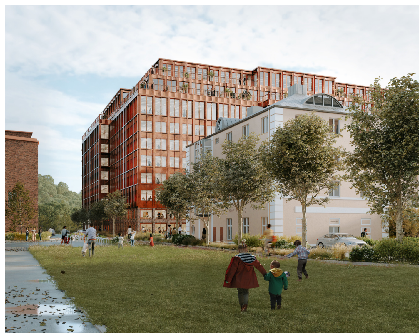
Skissförslag för ombyggnad kontor, sammanbyggnad av befintliga Tornen med ny fasad, Regnbågsgatan sedd från söder. Bild: Atrium Ljungberg AB/Kaminsky arkitekter.