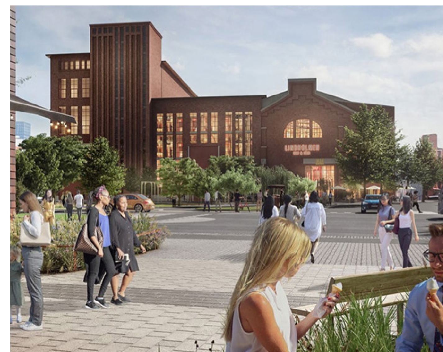
Ändring av verksamheter av befintlig byggnad M1 med ytterligare publik verksamhet. Skissförslag, perspektiv sett från väster.