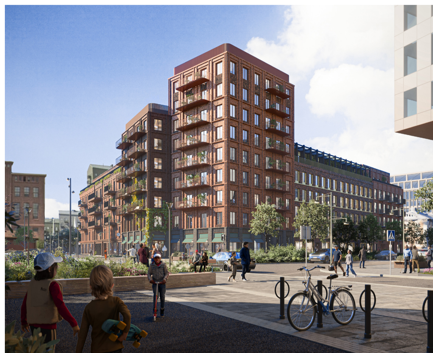
Skissförslag nya bostadskvarter. Perspektiv från sydöst. Bild Älvstranden utveckling/Okidoki Arkitekter

» Detaljplanen medger dessutom cirka 40 000 kvadratmeter BTA (bruttototalarea) nya verksamheter med centrumändamål och kontor, liksom ny användning av 50 000 kvadratmeter befintlig BTA industrifastigheter, till exempel för dagligvaruhandel.